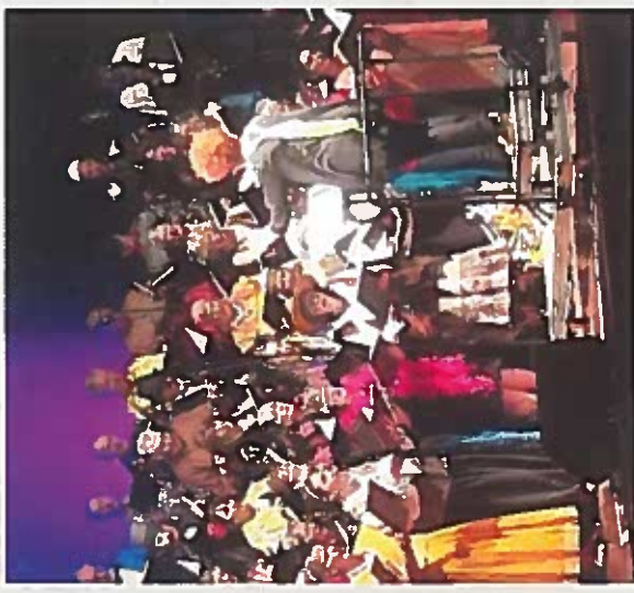
BILD VOM KONZERT IM BURGHOF OKT. 2015

... WIR SUCHEN NEUE SÄNGERINNEN UND SÄNGER ...